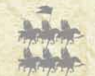
Chorągiew husarii Hrehorego Mirskiego +2 PS

Jednostki dodatkowe (max. ilość pułków + 2)