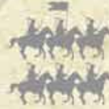
Chorągiew kozacka Bogusława Słuszki +1 PS (bez rohatoryn i kałkanów)