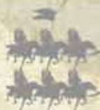
Chorągiew husarii Jerzego Karola Hlebowicza +2 PS